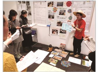
▲ ポスターセッションの様子