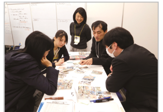
▲ ワークショップの様子