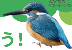
カワセミ @ゴールデンコメット