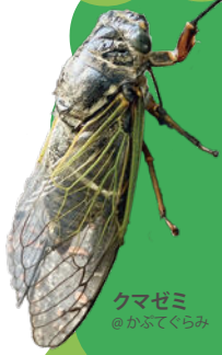
クマゼミ @かふてくらみ