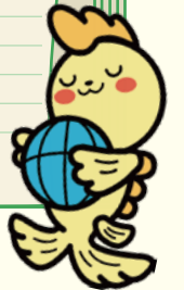
シャチのジュンちゃん