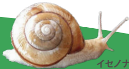
イセノナミマイ @たぬきじーりん