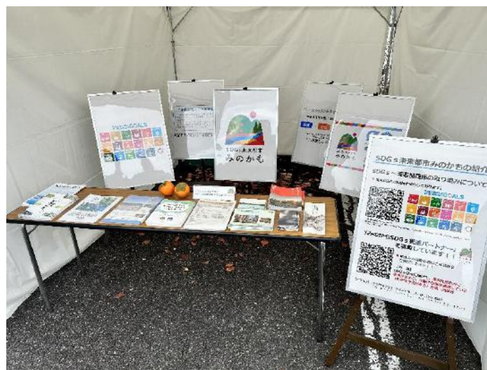
▼第12回みのかも市民まつり