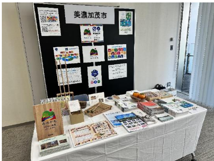
▼2023年度「第4回・SDGsフェスティバルin名古屋丸の内」