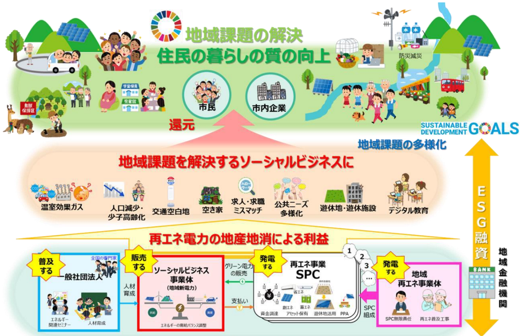
美濃加茂市 再生可能エネルギーの地産地消に向けた地域アライアンス